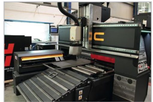
Folding hatch Trampilla abatible

· Puede estar a su vez conectado con una cinta extractora a una zona de selección y almacenaje.