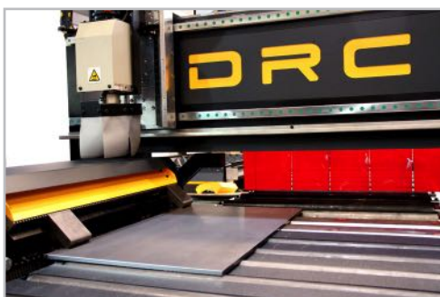
Clamping claw system Sistema de garras de sujeción