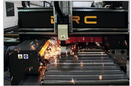
Plasma head cutting Corte con cabezal plasma

· Plasma, oxicorte o ambos en una misma estación. Posibilidad de equipar hasta dos (2) cabezales de plasma y hasta doce (12) sopletes de oxicorte.