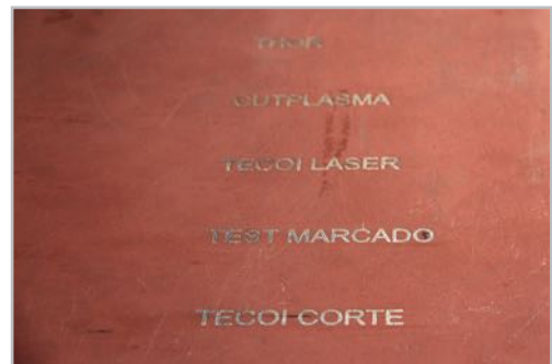
Laser marking systems Sistemas de marcado láser