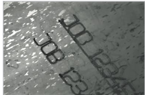
Marking systems Sistemas de marcado