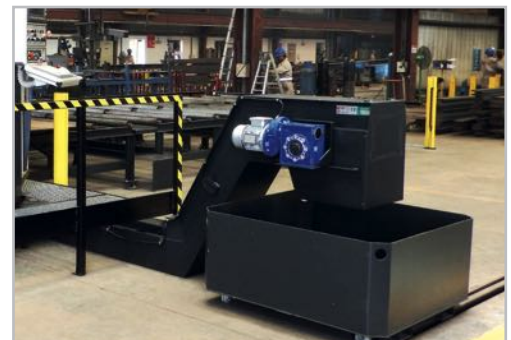
Chip and small pieces extraction belt Cinta extractora viruta o pequeñas piezas

· Con este sistema el tiempo no productivo se reduce hasta un 30%