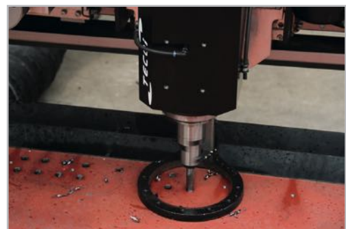
DRILTEC® machining Detalle del mecanizado DRILTEC®