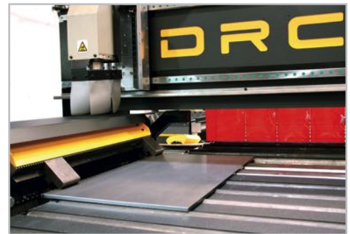
Claw system Sistema de Garras

· Especialmente diseñadas para el corte entre garras y reposición de material cuando se requiera.