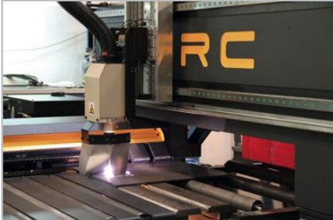
Plasma cutting Detalle corte con plasma