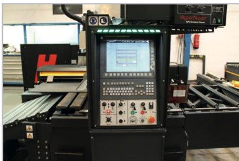
Control centre with touchscreen Centro de control con pantalla táctil